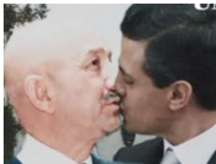
LA FAMILIA DE PEÑA NIETO

Dada la inminencia de las elecciones, la ínclita Rana Roja ha decidido dedicarle el número presente al al Gran Gandalla del evento. Helo aquí en todo su esplendor besando a su padrino: